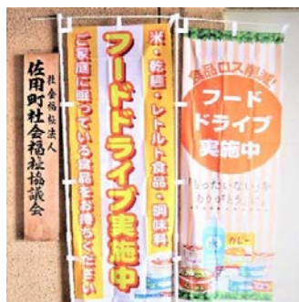
▲のぼり旗が目印です