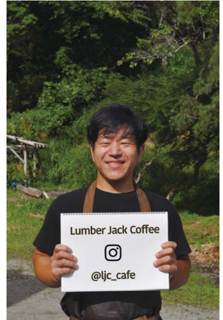
職場横の空き地にて。「Lumber Jack Coffee」はコーヒーの豆売りを始める際の屋号