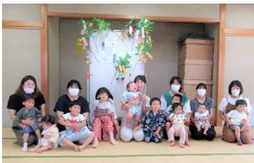
飾り付けをした笹の下で、記念に一枚

子育てひろば「ひまわり」の七夕会では、7組の親子が参加して笹飾り作りをしました。折り紙を使って、網飾りや輪つなぎ、ちょうちんなどの飾りを作り、笹に飾り付けをして、短冊にお願い事も書いて、みんなそれぞれ可愛い笹飾りが完成しました。笹飾り作りの後は、太鼓やマラカス、鈴などを使って「たなばたさま」や「きらきらぼし」を合奏しながらみんなで歌いました。また、大太鼓をみんなで順番にたたいてみました。最初は音にびっくりして控えめでしたが、慣れてくると元気よく大きな音で楽しそうにたたいていました。