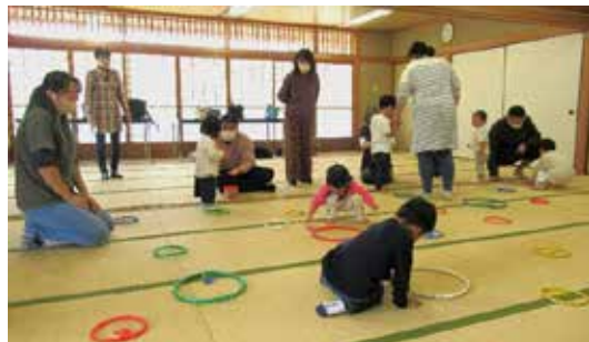
カエルを飛び跳ねさせて輪っかの中へ

音楽に合わせて挨拶や手遊びしたり、大きさの違うボールを上手にお隣さんへ渡していました。また、大小2種類の輪っかをたくさん床に置き、その輪の中にカエルのおもちゃを1個ずつ入れる遊びや、そのカエルはお尻を押さえると飛び跳ねるカエルだったので、親子で一緒に輪の中にカエルを飛び跳ねさせて入れたり一人で入れてみたりと初めてのおもちゃに興味津々。その他、スカーフやカラーボールも使い、親子でいっぱい体を動かして楽しい時間を過ごしました。