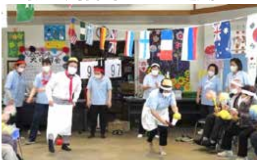
職員種目に利用者も大声援

きらめきケアセンターでは、10月16日(月)から10月21日(土)まで、季節行事として運動会を開催。座ったままボールをすくってカゴに入れる玉入れや、被り物とパンツを身につけてボールを運ぶ職員リレー等で盛り上がりました。