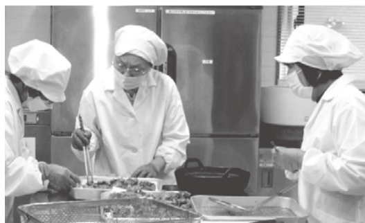
しっかり加熱されているか確認中

す。配食事業には厚生労働省が公表したガイドラインがあり、配食を通じた地域高齢者等の健康支援推進に努めることが求められています。そういった面から、日々変化する利用者の特性の把握について、配食担当、調理担当